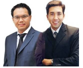
อดิศักดิ์ ผู้พัฒนทรัพย์กุล, CFA วิษณุ ธรรมบำรุง

รายงานฉบับนี้จัดทำโดยบริษัทหลักทรัพย์ ทิพย์ เวช จ้ากิด (มหาชน) โดยจัดทำขึ้นบนพื้นฐานของแหล่งข้อมูลที่เชื่อถือได้ซึ่งมีวัตถุประสงค์เพื่อให้บริการเผยแพร่ข้อมูลแก่นักลงทุนและใช้เป็นข้อมูลประกอบการตัดสินใจซื้อขายหลักทรัพย์ แต่ไม่ได้มีเจตนาชี้แนะหรือเชิญชวนให้ซื้อหรือขายหรือประกันราคาหลักทรัพย์แต่อย่างใด ทั้งนี้รายงานและความเห็นในเอกสารฉบับนี้อาจมีการเปลี่ยนแปลงแก้ไขได้ หากข้อมูลที่รับมาเปลี่ยนแปลงไป การนำข้อมูลไปปรากฏอยู่ในเอกสารฉบับนี้ ไม่ว่าทั้งหมดหรือบางส่วนไปห้าห้า ดัดแปลง แก้ไข หรือนำออกเผยแพร่แก่สาธารณชน จะต้องได้รับความยินยอมจากบริษัทก่อน