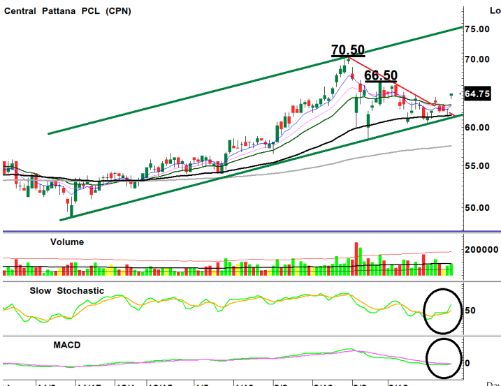
Central Pattana PCL (CPN)

รายงานฉบับนี้จัดทำโดยบริษัทหลักทรัพย์ ทีทีบี เบลู จำกัด (มหาชน) โดยจัดทำขึ้นบนพื้นฐานของแหล่งข้อมูลที่เชื่อถือได้ รับมาและพิจารณาแล้วว่าน่าเชื่อถือ ทั้งนี้มีวัตถุประสงค์เพื่อให้บริการเผยแพร่ข้อมูลแก่นักลงทุนและใช้เป็นข้อมูลประกอบการตัดสินใจซื้อขายหลักทรัพย์ แต่ไม่ได้มีเจตนาชี้แนะหรือเชิญชวนให้ซื้อหรือขายหรือประกันราคาหลักทรัพย์แต่อย่างใด ทั้งนี้รายงานและความเห็นในเอกสารฉบับนี้อาจมีการเปลี่ยนแปลงแก้ไขได้ หากข้อมูลที่ได้รับมาเปลี่ยนแปลงไป การนำข้อมูลไปปรากฏอยู่ในเอกสารฉบับนี้ ไม่ว่าทั้งหมดหรือบางส่วนไปห้าห้า ดัดแปลง แก้ไข หรือนำออกเผยแพร่แก่สาธารณชน จะต้องได้รับความยินยอมจากบริษัทก่อน